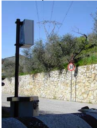
Figura 1 - La centralina posizionata in prossimità della linea La Spezia - Acciaiole.

Il bollettino viene inviato a tutte le Amministrazioni coinvolte e pubblicato sul sito di ARPAT.